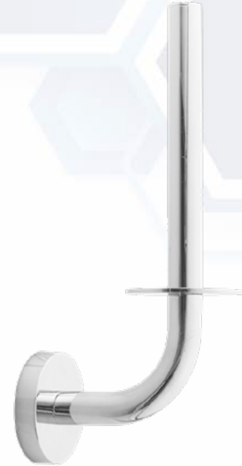
ESQUEMA DE PRODUCTO:

Por medio de tornillos y tacos incluidos.