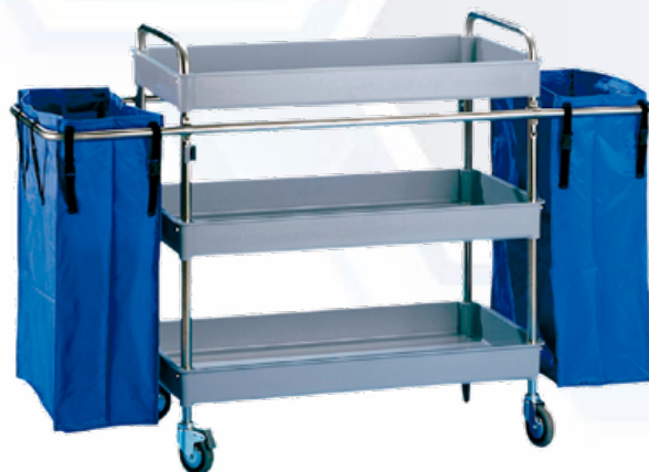
ESQUEMA DE PRODUCTO: