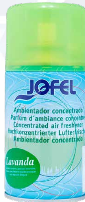
ESQUEMA DE PRODUCTO: