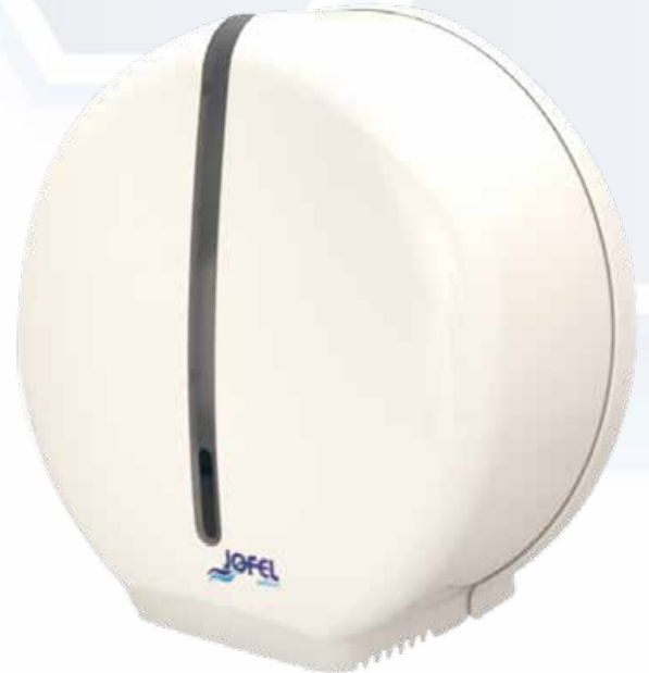
ESQUEMA DE PRODUCTO: